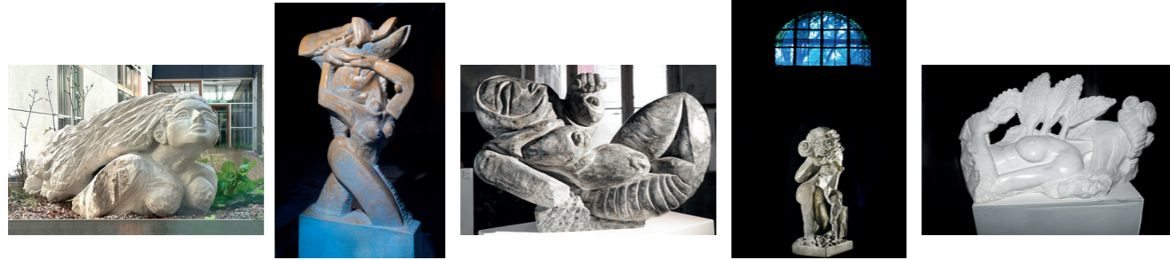
Entwurf für eine gemeinsame Arbeit der Bildhauerin Danit und dem Fotografen Beat Presser für die NordArt 2024.